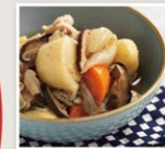
液 + 粉 + 乾 しいたけたっぷり 肉じゃが