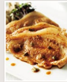
粉 豚の山椒 しょうが焼き