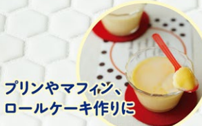
プリンやマフィン、 ロールケーキ作りに

いちごにかけるだけじゃない! れん乳があれば、毎日のおかずもおやつも こ～んなにおいしくなっちゃいます