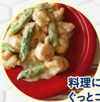
料理にもお試しあれ! ぐっとコクが出るんです!